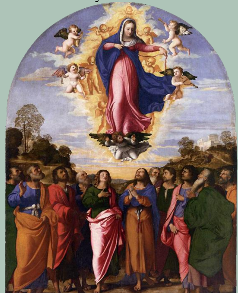
Asunción de María de Palma il Vecchio, c.1512-1514, Dominio público

El 15 de agosto celebramos la Fiesta de la Asunción; el día que recordamos a Nuestra Santísima Madre siendo asunta al cielo y coronada como reina.