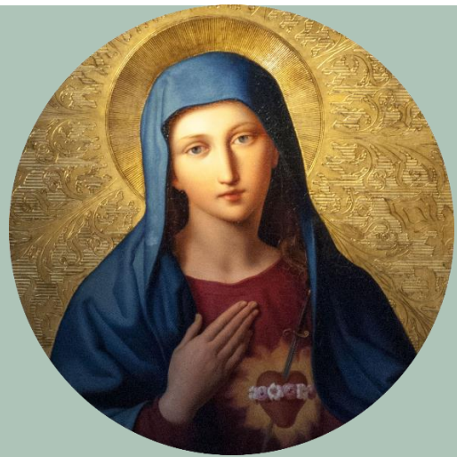
El Corazón de María de Leopold Kupelwieser, c. 1796-1862. Dominio público

Obra de arte: Curación del ciego por Jesucristo, Carl Bloch, c. 1871, Dominio Público