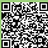
Copa del Obispo