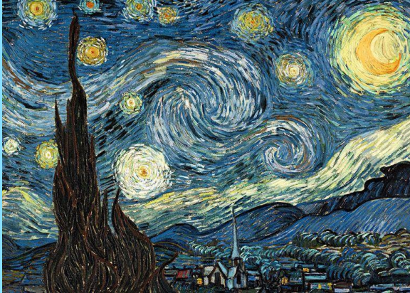
La Noche Estrellada, Vincent VanGogh, 1889

Mientras nos preparamos para el nacimiento de Cristo, Lucas nos advierte sobre la segunda venida de Jesús en los últimos tiempos. No sabemos el día ni la hora en que nos encontraremos con Él cara a cara. Tal vez sea a través de la muerte, o tal vez todavía estemos vivos para la segunda venida de Cristo. Independientemente de esto, debemos estar en guardia ... debemos estar vigilantes.