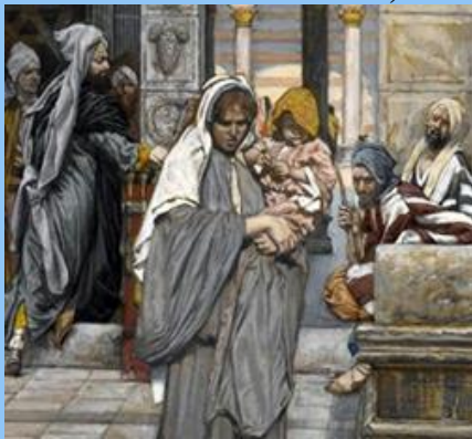
James Tissot 1886-1894

Pablo le dice a Timoteo "trata a las mujeres mayores como madres" y "honra a las viudas". En casi todas las iglesias hay personas que necesitan un hombre que las ame como si fueran su hijo, una mujer que los ame como una hija, y niños que los amen como un nieto. Ya sea que se trate de proporcionar dinero o amor, la iglesia es el medio de Dios para cuidar de su pueblo. No descuidemos un ministerio tan grande y preciado, un ministerio que es tan cercano y querido al corazón de Dios.