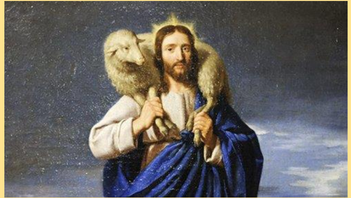
Jesús Buen Pastor 1602 - Le Bon Pasteur Philippe de Champaigne

Aunque a veces actuamos como ovejas, que comúnmente se cree que son animales tontos, en realidad no lo somos. Después de todo, somos seres humanos creados a imagen de Dios, aunque tenemos una naturaleza humana caída y pecadora. Aunque la imagen de un rebaño de ovejas y Pastor que los cuida es una imagen útil para expresar la relación de Cristo con la Iglesia, no es toda la historia. Somos responsables de nuestro comportamiento de una manera que ninguna oveja ni ningún otro animal lo es. Y eso es lo que los oyentes de Pedro reconocieron cuando escucharon el primer sermón cristiano el día de Pentecostés. Lo oyeron anunciar lo que Dios había hecho por ellos y le preguntaron: "¿Qué vamos a hacer?". En otras palabras, ¿qué respuesta debemos dar?