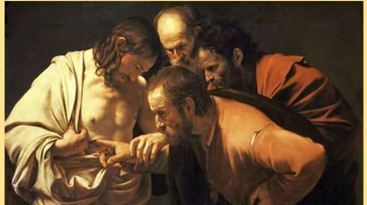
Caravaggio - La incredulidad de Santo Tomás (1601-1602)

Cristo se muestra a Tomás. Tomás está llamado a ver, tocar y creer. Los Apóstoles restantes son testigos del Señor Resucitado. Tomás, ahora tiene la "prueba viviente" que necesita y pasa de la incredulidad a la fe. Su confesión de fe es sencilla y profunda: "¡Señor mío y Dios mío!"