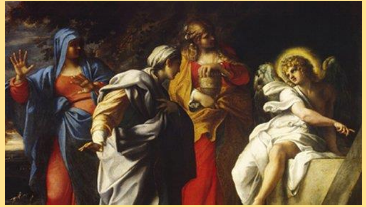
Annibale Carracci - Mujeres santas en la tumba de Cristo (c. 1590)

La Resurrección es el clímax de la Encarnación. Confirma la divinidad de Cristo y todas las cosas que hizo y enseñó. Cumple todas las promesas divinas que se nos hicieron. Además, Cristo resucitado, vencedor del pecado y de la muerte, es el principio de nuestra justificación y nuestra resurrección. Nos procura ahora la gracia de la adopción filial que es participación real en la vida del Hijo unigénito.