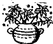
Flores de Pascua © Annika Nelson

Abstención: Todos los católicos de 14 años de edad y mayores tienen la obligación de abstenerse de comer carne el Viernes Santo y todos los viernes de Cuaresma.