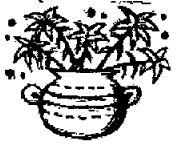
Flores de Pascua

Palabras Pastorales Verano 2017 wlpcc@jspaluch.com